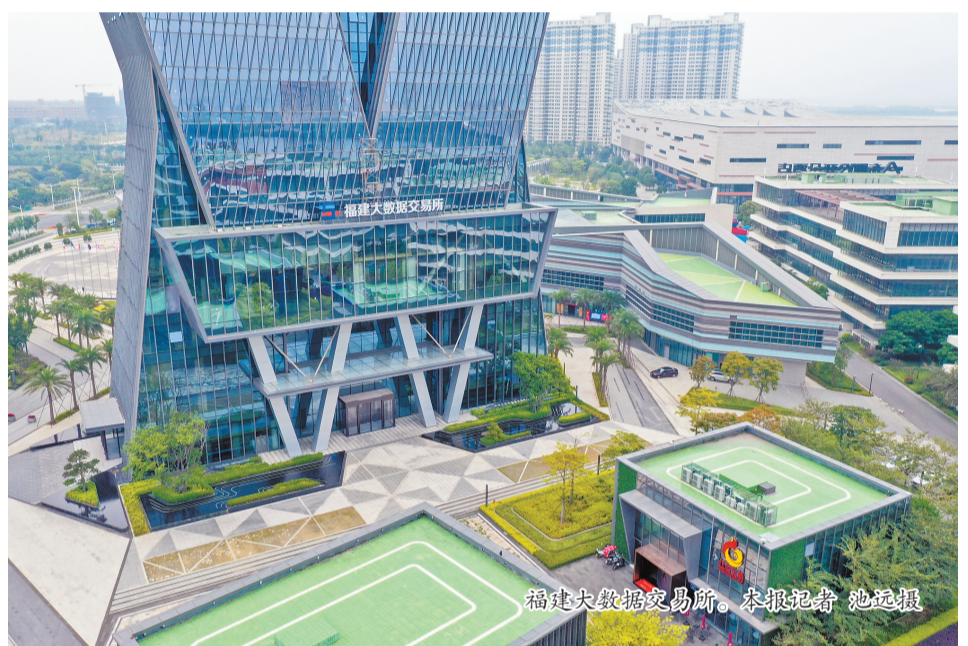
福建大数据交易所。

在数字浪潮面前,长乐立身“数字福州”建设主阵地之一,不仅“心中有数”,而且“手中有术”。 从一批工业互联网产业数字化“落地生根”;到一批“数字福州”行动项目和新基建项目应运而生,再到多项支持数字经济发展的政策出台实施,长乐,驰骋“数海”,逐浪“数尖”。 围绕功能性新材料、数字经济、新兴风口等四大方面13条重点产业链,长乐不断健全产业链“链长制”,发挥全省领先新基建作用,工业(产业)园区标准化建设深化改革行动深入实施,产业链持续向中高端迈进。 在长乐区强劲的“数字基因”加持下,中国工业互联网研究院福建分院、国家工业互联网大数据中心福建分中心等重点落户;省大数据集团总部、华为人工智能计算中心等顺利落地。 数字赋能,智慧加持。网龙网络连续十年入选中国互联网企业综合实力前百家企业;数字福建云计算数据中心入选国家新型数据中心典型案例;大东海实业、恒申集团、永荣控股数字化转型不断深化,入围中国企业500强、中国制造业企业500强。 “数”见未来,未来已来。当前,第六届数字中国建设峰会分会场、全省产业数字化转型工作现场会等成功举办;福建大数据交易所入驻福州新区东湖数字小镇运营,累计签约数商超100家,服务数商超400家,带动产业链上下游产值超百亿元。 长乐,已驰骋在数字经济“新蓝海”,智能汽车数字经济产业园等超40个,总投资400亿元的数字经济重大项目策划生成,全力打