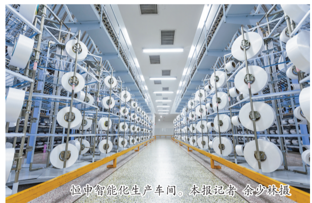
恒申智能化生产车间。

长乐区立足五港齐聚、多区叠加等先行优势,创新“片区+项目”组团式联动开发模式,五大产业片区、四大功能片区各有侧重、协同共进。 放眼长乐大地,热火朝天的建设场景涌动激情:福州(长乐)国际航空城重点项目抢工期、抓进度,不断刷新项目“进度条”;“天字一号”机场二期、“地字一号”高铁进机场项目提速增效,滨海快线、G316等大道加快建设;“三馆三中心”(图书馆、档案馆、综合文化馆、妇女儿童活动中心、青少年活动中心、职工活动中心)主体工程封顶,工人全力为集成一体的多功能、高品质文化新地标奋力拼搏。 徜徉于智能制造工厂,车间内,纺织企业拉开架势,生产正酣,智能化的生产设备运转不停,抢订单、抓生产,数字赋能,企业迈向中国制造。 驻足滨江滨海文旅片区,闽江河口湿地入选国际重要湿地名录,申遗工作稳步推进;阔别多年的下沙海滨度假区全新开放,下沙记忆席卷而来。 屹立在历史的风口,长乐今年迎来建县1400年,经济高质量发展与历史文化保护弘扬交相呼应,展现出历史人文与现代化城市建设和谐共进的格局。 聚焦城市更新片区,统筹城市双修和全面城市化,汾阳溪水系治理打通城市水脉,和平街改造提升擦亮城市景观。 激昂奋进,热情迸发。长乐正全面融入福州新区和平潭综合实验区一体化高质量发展,构建海滨福州的门户和枢纽。 抓项目就是抓发展,谋项目就是谋未来。新年伊始,春节企业家大会、政企企发展大会等接连召开,中林福建总部、医疗器械产业园等一批新兴产业项目集中签约,32项、总投资234亿元的重大项目集中开工,229项、总投资2744亿元的项目列入年度省市重点盘子,“招”“落”“投”掷地有声。