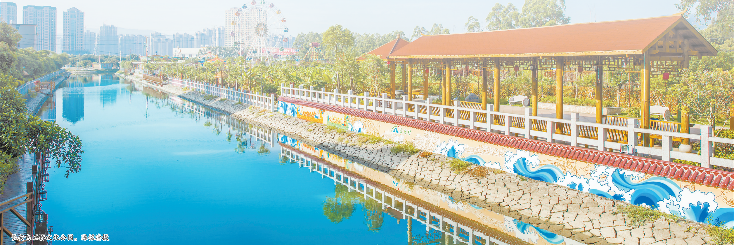
长安白石桥文化公园。