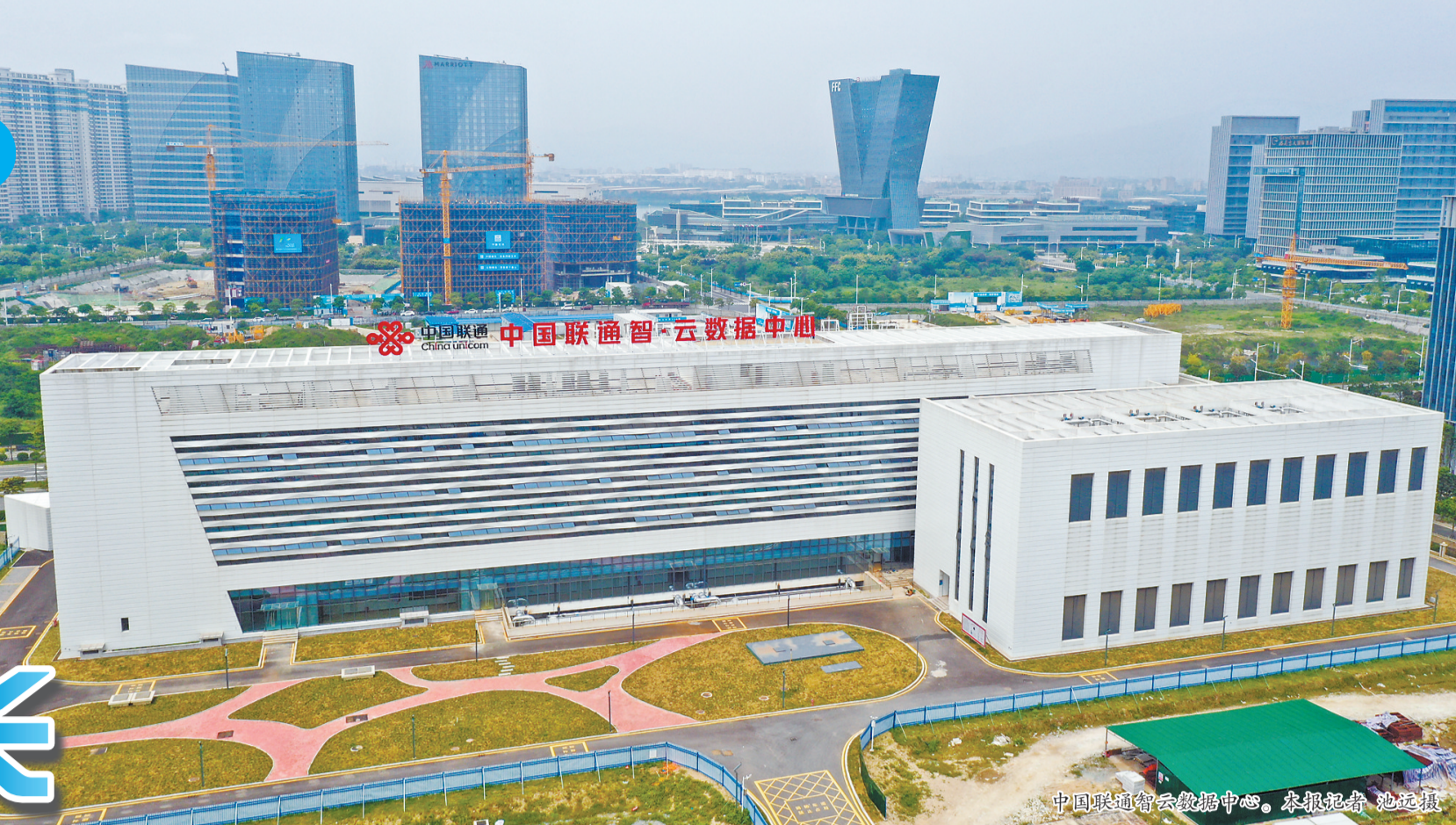
中国联通智云数据中心。

海滨邹鲁、华侨之乡,全国综合实力百强区第64位;中国工业百强区第45位;全省城市发展“十优”区第5位……长乐,一座因海而兴,拓海而荣的魅力新城,正乘势而上、聚势图强。 以“学”提能力、以“敢”促拼闯、以“干”求实效。今年以来,传承弘扬“3820”战略工程思想精髓,长乐区以强省会、福州都市圈等重大战略为动力,抢抓福州新区建设历史机遇,深入实施“深学争优、敢为争先、实干争效”领航现代长乐、国际航城建设行动,以实干实效奋战开局年,全面掀起攻坚热潮。