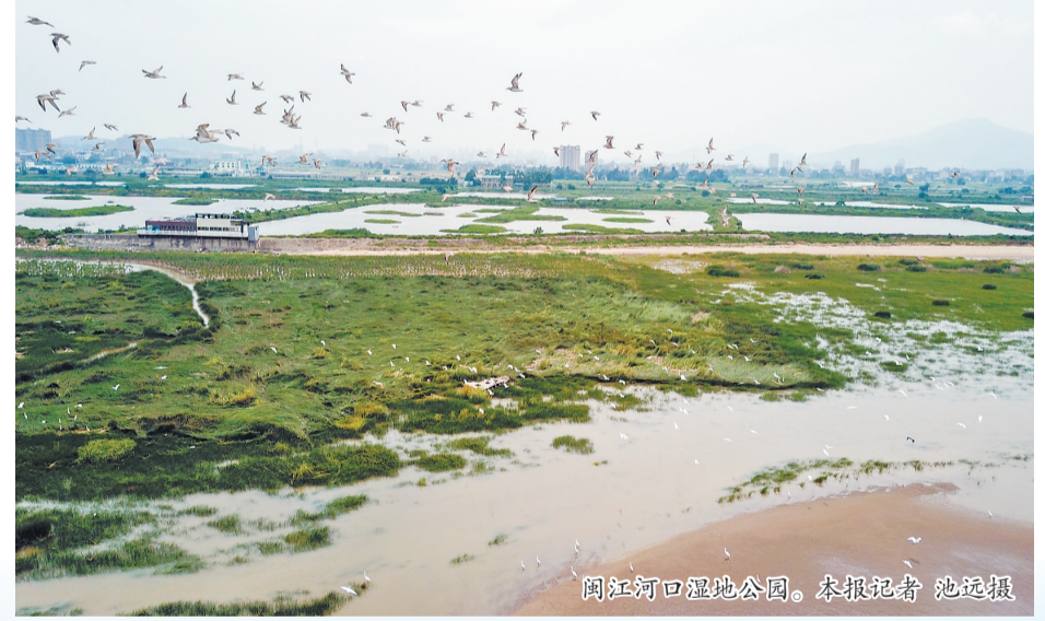
闽江河口湿地公园。

民生为先,幸福加码。长乐区始终坚持“问需于民、问计于民、问效于民”,答好民生新答卷,绘制生态宜居的海滨城市、山水城市新画卷。 持续开展“护河爱水 清洁家园”行动,铺开农村人居环境整治积分制,强化“一老一小”两大群体服务保障,建设“长者食堂+学堂”,扎实推进集团化办学、集成化医改,群众路小学滨海校区、华山医院二期等高品质民生配套即将投用,长乐区越发宜居宜业。 以乡村振兴为抓手,长安村不夜城街市等一批产业振兴示范点不断涌现,“三治融合”乡村治理模式持续深化,实现基层党建和乡村振兴同频共振,基层治理能力不断提升。 突出均衡可及,推动“我为群众办实事”常态化长效化,细分6610个微网格,创新“千名医师下基层”“百万警进千万家(群)”等形式,加快老旧小区改造、第二供水通道等项目建设,集中攻坚4800余件群众身边的高频小微民生事项,推动民生实事更有温度精度,群众更加有感可知。