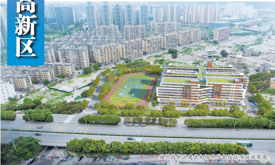
福州高新区建平初级中学新校区项目效果图。

本报讯(记者 林榕昇 通讯员 许昌)25日下午,福州高新区第二季度重大项目集中开工仪式在福州高新区建平初级中学新校区项目现场举行。福州高新区此次集中开工10个重大项目,包括7个产业项目、2个社会民生项目、1个基础设施项目,总投资62亿元,年计划投资19.1亿元。