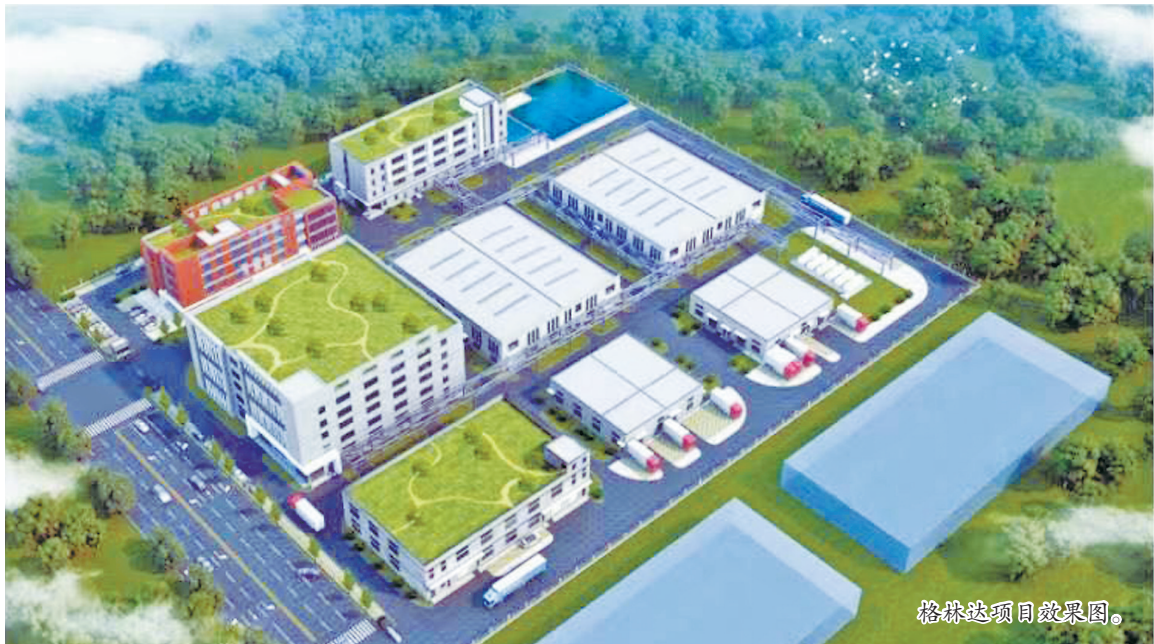
格林达项目效果图。

本报讯(记者 林文婧 通讯员 叶建隆 余盛岚)25日,连江县第二季度重大项目开工仪式在“福州格林达年产油墨7500吨、稀释剂2000吨、电子胶水1300吨项目”现场举行。第二季度,连江开工12个项目,总投资43亿元,年度计划投资21.1亿元。其中,产业项目9个、基础设施项目2个、社会民生项目1个,进一步掀起大抓项目、抓大项目热潮,助力现代化国际城市建设。