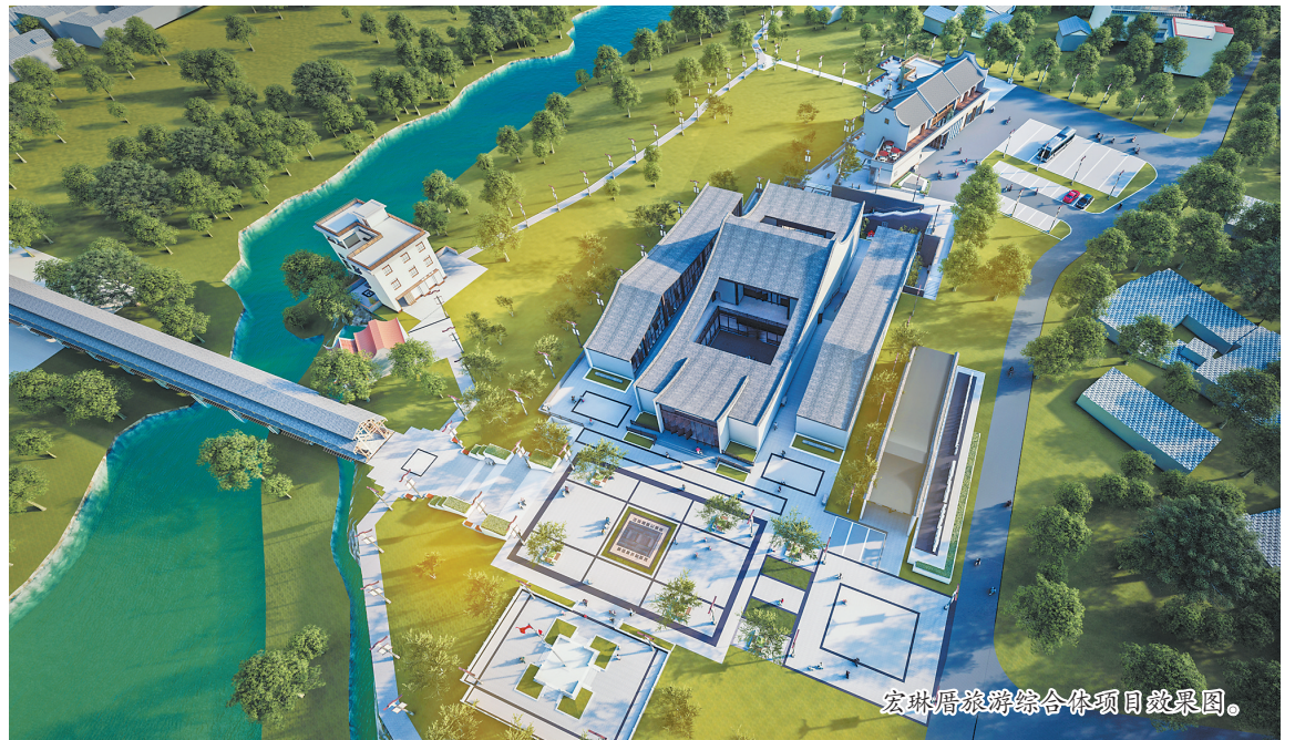
宏琳厝旅游综合体项目效果图。

基础设施项目方面,闽清县城乡污水垃圾建设项目,拟建设污水管网490.999公里,污水处理站7座,污水提升泵站15座,建设乡镇生活污水改造提升治理设施、飞灰填埋场工程、填埋场进场道路、垃圾焚烧发电厂取水工程,项目建成后每天可新增污水处理能力1800吨/日。坂中小区及配套基础设施建设(一期)将进一步完善当地生活配套设施,建设安置房,提升群众生活幸福满意度,建成后能带动周边服务业、市政配套等建设与发展,项目建成后可新增容纳人口800人。