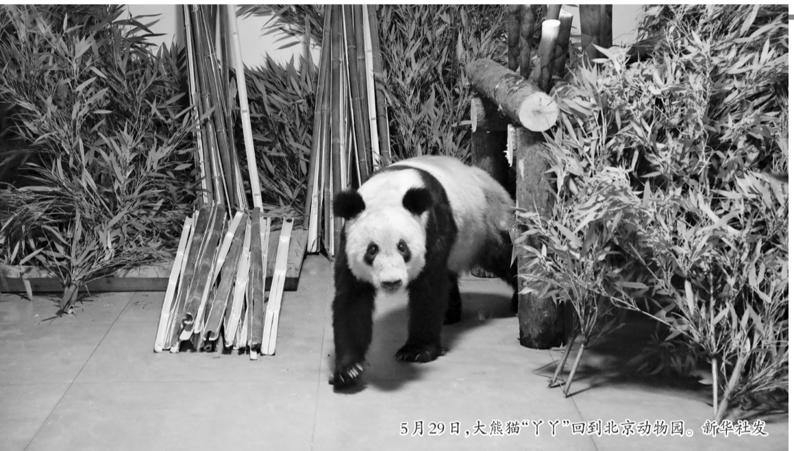
5月29日,大熊猫“丫丫”回到北京动物园。

因“丫丫”已进入老年,回京后需静养,适应新的环境,现不对外展出。北京动物园将通过官方微博定期发布“丫丫”相关信息。