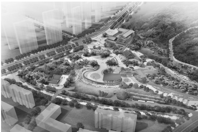
三江口植物园效果图。

本报讯(记者 唐蔚婧)记者昨日从福州市三江口植物园新闻发布会上获悉,三江口植物园一期将于12月31日开放,试运营期暂定5个月,每日开放时间定为上午9:00至下午6:00(下午5:00停止入园),在此期间门票免费。