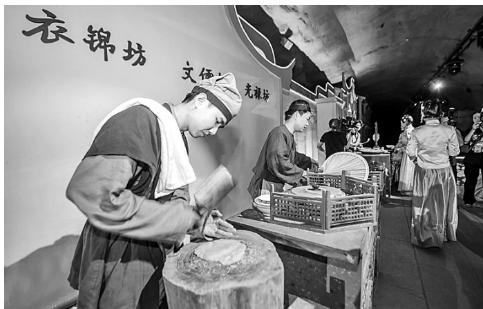
沉浸式表演展现闽都烟火气。