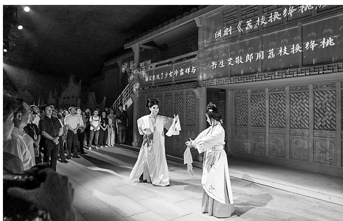
闽剧《荔枝换绛桃》表演。