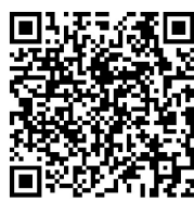
有声专栏,扫码聆听。

《琉球官话课本三种校注与研究》一书,收录三种写于18世纪的官话口语教材。考虑到外国学生的汉语基础,书中对话多简短有趣,故事性极强;同时又由于作者或修订者多是福州本地人,字里行间“福普”尽显,是了解18世纪受方言渗透影响的福州式官话的难得材料。读者从中在品读18世纪福州市井文化的同时,还可以根据校注者提示,领略两三百年来福州官话的独特魅力。