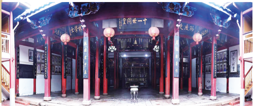
宗祠为土木结构，共六扇五间。