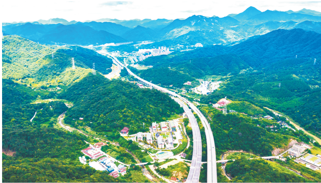
北二通道穿越国家森林公园保护区,是一条生态通道。