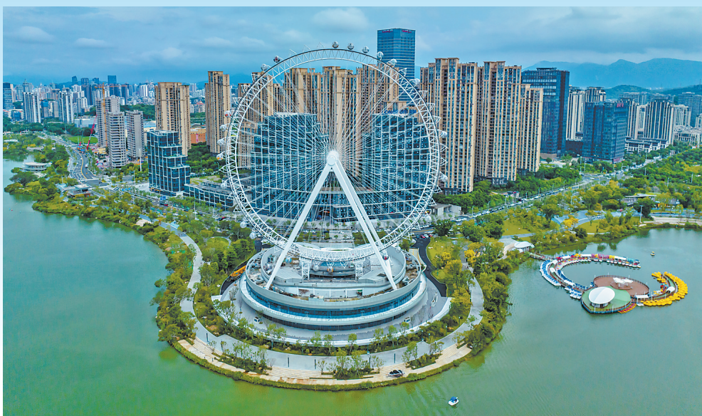
晋安湖摩天轮安装轿厢。