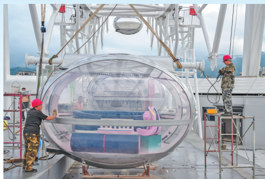
工作人员正为摩天轮安装轿厢。