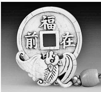
象牙雕福在眼前挂牌。

简介:大梦书屋联合cola实验室带来“认识食品添加剂”科普实验系列活动——“生活中的科学奥秘”,专业科研老师将为读者书友带来精彩有趣的食品添加剂科普+科研小实验,首期活动中将围绕食品中的添加剂成分,共同了解、辨别各类食品中的添加剂量,参与实验,制作原味食品及添加剂食品,在创作中探索科学原理。