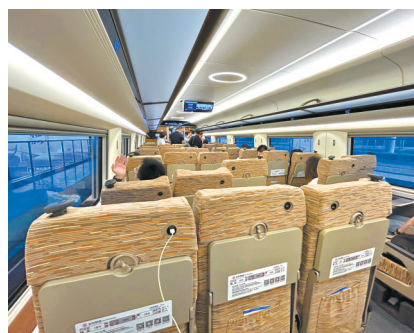
二等座有USB充电接口。

“在信息系统方面，该车采用以太网控车、车载安全监测等智能运维和监控系统。车载安全监测系统对轴温系统、失稳系统、平稳系统等进行了融合集成，并新增了轴箱、齿轮箱轴承振动监测功能，能够主动识别车组异常状态并及时报警。这进一步提升了列车运行、安全监控等方面的智能化水平。”张仁强说。