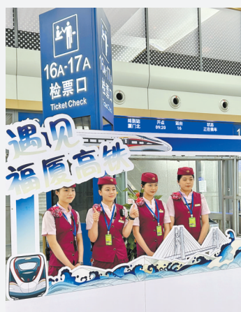
4名青春靓丽的“动姐”在出发前合影。