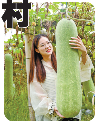
村内种植的冬瓜有半人高。