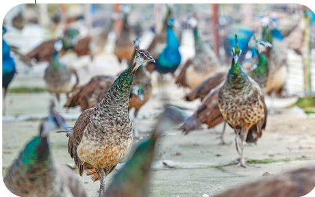
在养猪旧址上建起的孔雀园。