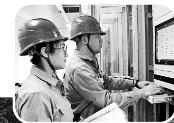
工作人员在变电站内进行操作。

国网福州供电公司将持续以打造“三大三先”高质量发展示范电网为目标,以建设国际领先城市电网为契机,高标准打造坚强智能省会电网,加快构建新型电力系统,进一步完善福州区域网架,大幅提高供电可靠性,促进清洁能源在更大范围优化配置,助力福州绿色低碳发展。