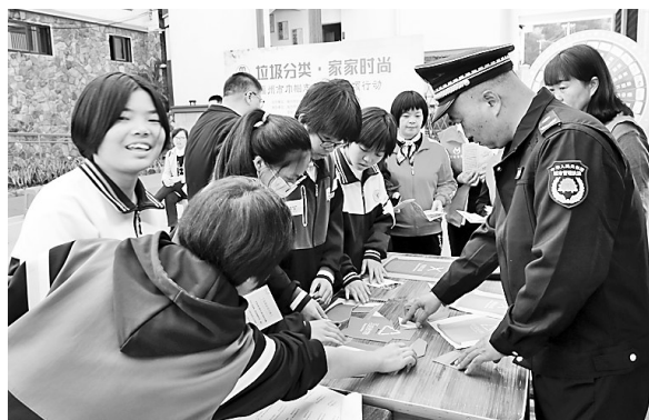
晋安区寿山乡岭头大院热闹非凡。