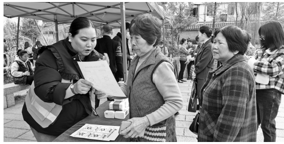
志愿者向村民讲解垃圾分类知识。

昨日,福州市生活垃圾分类工作领导小组办公室通报了10月全市通过“飞行检查”排出的垃圾分类“十佳”“十差”小区名单。