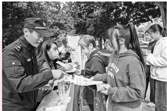
晋安区城管向市民分发垃圾分类宣传页。

当天,记者走进阳岐片区,一路上石板村道干净整洁,古色古香的建筑错落有致,阳岐河水清岸绿,园林造景美观舒适。村民悠然自得,沿着阳岐河边散步。