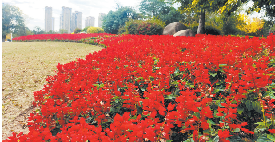
海峡国际会展中心周边花化美化布置。