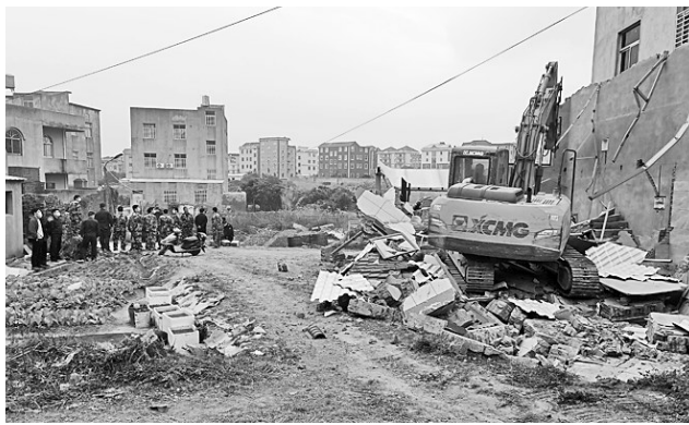
龙田镇际塘村违建拆除现场。

龙田镇依托小微权力工作群、“特色龙田”微信公众号等线上平台持续推送治违工作相关内容,并通过广播、悬