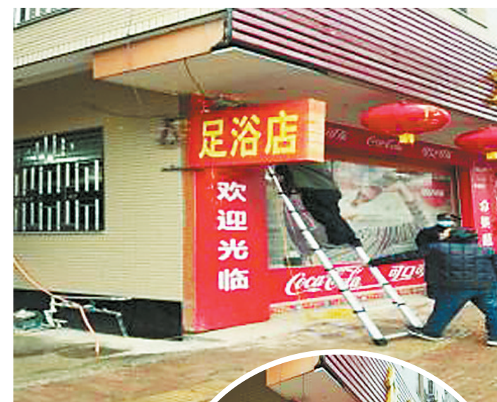
▲琅岐镇工作人员正在拆除违规广告牌。

执法人员介绍说,这些违规广告牌遮挡视线,容易干扰行人及车辆正常通行,还有掉落等安全隐患。下一步,琅岐镇将进一步加强户外广告管理,重拳出击整治户外广告乱象,确保违规的、存在安全隐患的、影响市容的户外广告设施得到全面清理,维护城乡环境整洁、美观、有序。