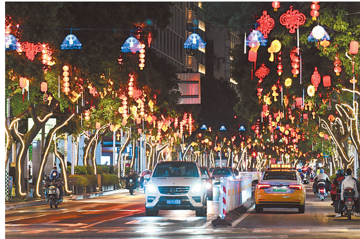
津泰路两侧行道树上挂满彩灯。

干道进行街景布置。鼓楼区园林中心在区属公园等处布置大红灯笼、花卉等,营造浓厚的节日氛围。街景氛围布置使用了传统中国结、水滴灯、福字灯笼等,还在设计主题、设计元素上进行了创新,采用新型光影技术和时尚“新中式”元素烘托节日氛围。