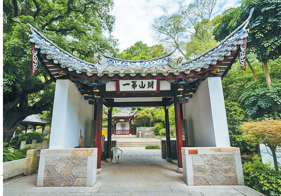
七里七亭之闽山第一亭。

这条登山路，从樵夫走的羊肠小道变为石板条路，传最早为闽王王审知在鼓山修建高僧神晏