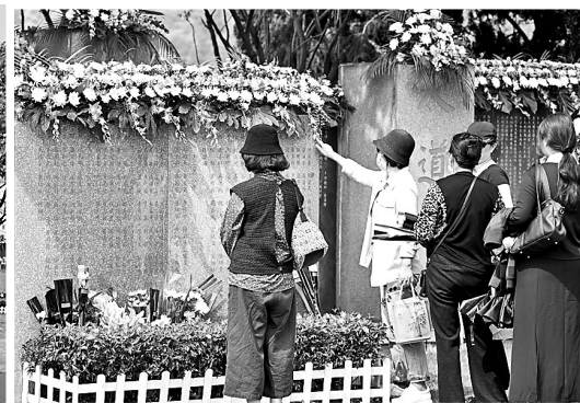
▲捐献者家属在纪念碑上寻找家人的名字,寄托哀思。

“生命·礼赞——福州市2024年遗体 and 人体器官捐献者缅怀纪念活动”昨日举行。