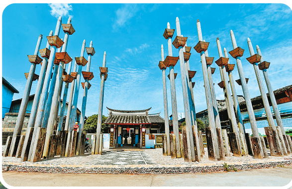
林家村旗杆林。

陈太尉宫历经宋、明、清等朝代多次扩建,具备不同时期的建筑风格特点,整座建筑均为抬梁穿斗式构架、榫卯结构,被文物专家誉为“古代建筑博物馆”,具有很高的历史、艺术、科学研究价值。