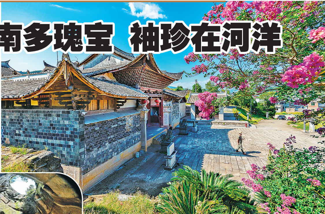
国家级文保单位陈太尉宫。

近年来,罗源县文旅部门及中房镇政府依托当地丰富的历史文化资源,深入挖掘文化内涵,积极发展旅游项目,农文旅融合发展。游客在中房镇可看山水、赏桃花、走古道、游古厝,感受千年古镇的独特魅力。