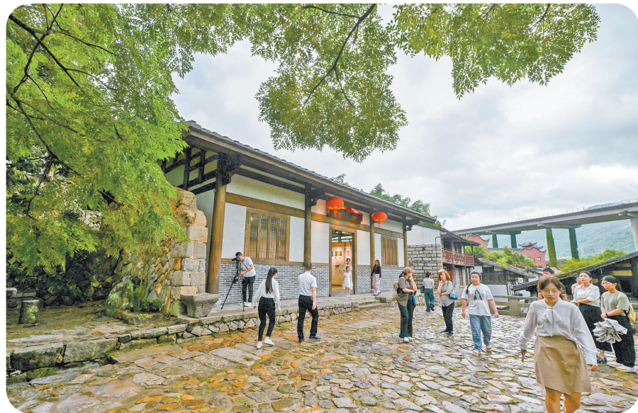
罗宁古官道文化展示馆昨日开馆。

罗宁古官道是不可再生、不可替代的闽都文化灿烂瑰宝。罗源县深入挖掘罗宁古官道历史文化,让罗宁古官道在新时代焕发新活力、绽放新光彩。