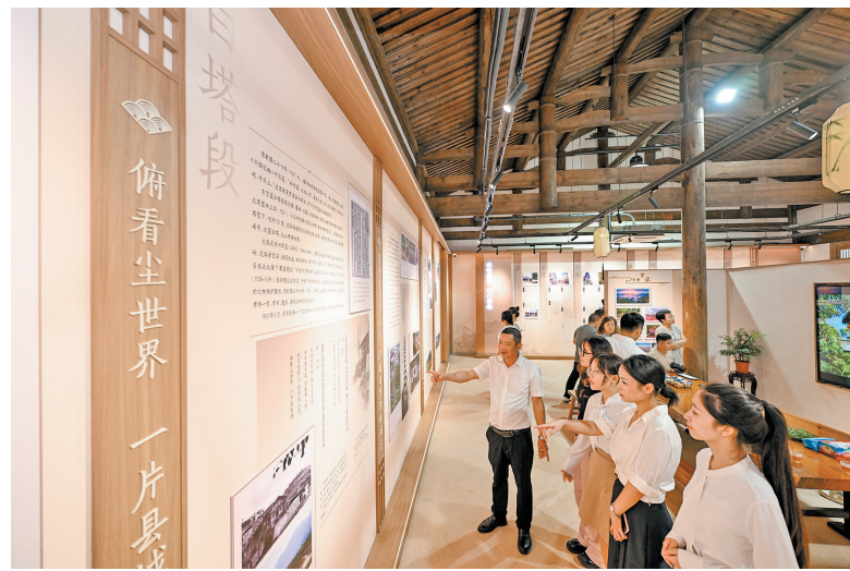
市民游客在馆内参观。

“我们希望把罗宁古官道展示馆打造成罗源历史文化金名片,让罗宁古官道成为新时代的文化道、生态道、幸福道。”罗源县主要领导介绍,下一阶段将围绕罗宁古官道文化展示馆,精心设计研学、旅游路线,让罗宁古官道在提供公共文化服务、满足人民精