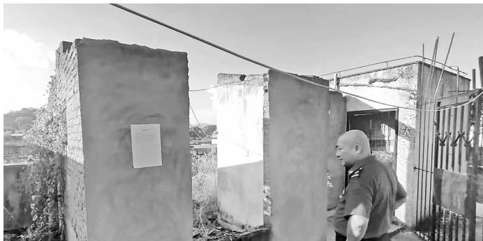
执法人员查看西洋新村楼顶违建情况。该违建目前已被拆。