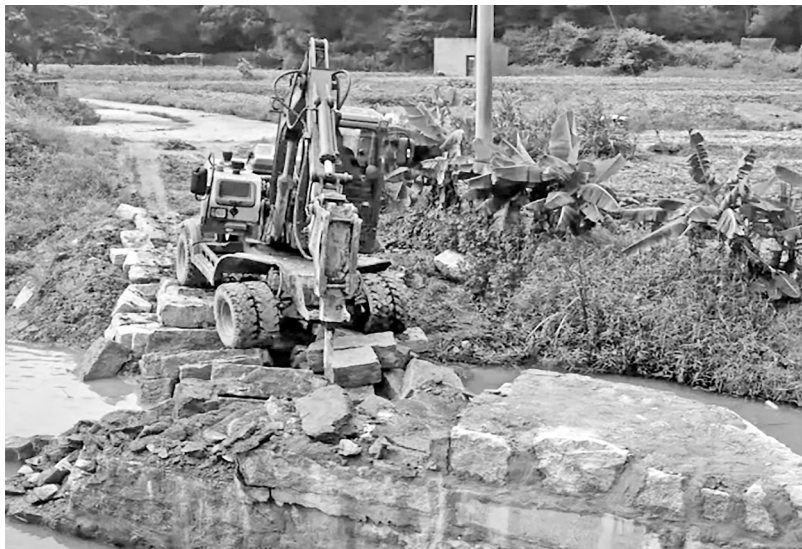
福清江阴镇违建桥梁拆除现场。