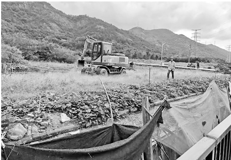
福清龙山街道违建养殖场拆除现场。

龙山街道相关负责人表示,下一步,街道将继续严厉打击畜禽养殖建筑违建行为,不定期开展“回头看”,巩固和扩大整治成果,杜绝违建现象反弹。同时,进一步建立健全长效监管机制,加强日常巡查和执法力度,推动专项整治工作落到实处,全力守护绿水青山。