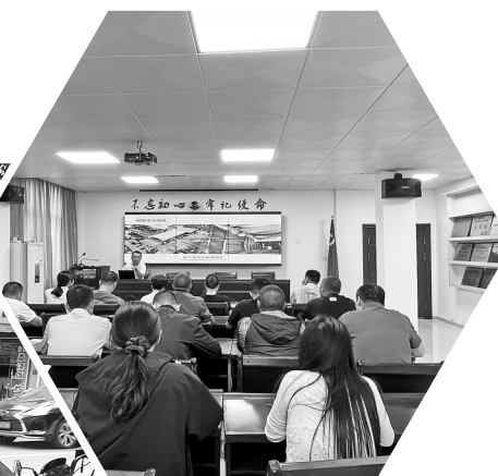
罗源起步镇开展“两违”网格化巡查业务培训。