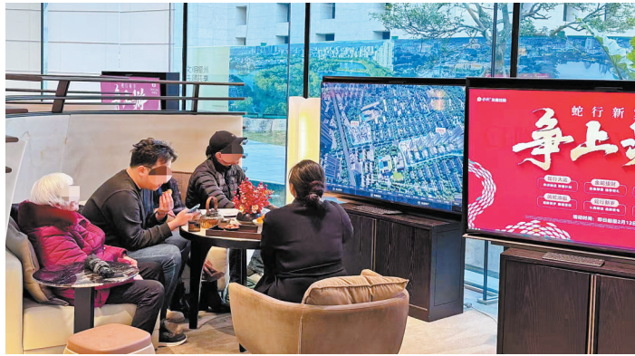
市民在售楼处看房。