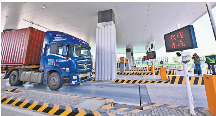
集装箱车过卡口演示。