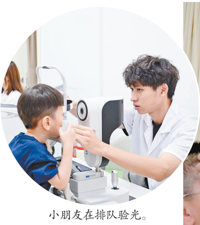
小朋友在排队验光。