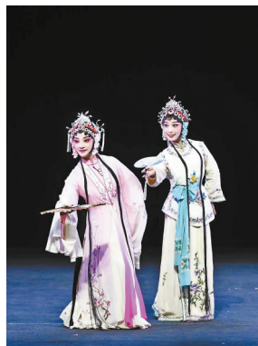
闽剧《牡丹亭·游园》剧照。

8月3日两场演出的内容是:闽剧《活捉三郎》,闽剧《虹霓关·对阵》,闽剧《双蝶扇·忆双蝶》,闽剧《六离门·责子》,闽剧《卖水》,闽剧《冯梦龙断案·郊别》,闽剧《红楼梦·黛玉葬花》,闽剧《寿州救驾》。